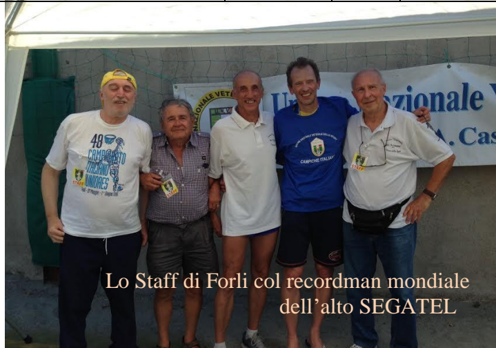
Lo Staff di Forli col recordman mondiale dell'alto SEGATEL